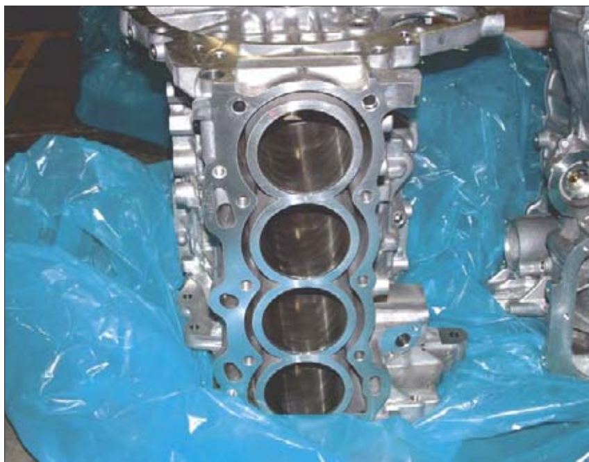
PE fólie s inhibitorem VCI 126 a čistícím a konzervačním prostředkem VCI 418

centraci požadované pro příslušný kov nebo slitinu. Zcela analogicky účinkují papírové vaky a krabice.