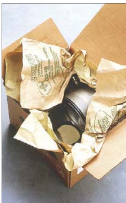
Příklad použití papírů s inhibitorem VCI 146