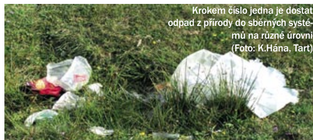
Krokem číslo jedna je dostat odpad z přírody do sběrných systémů na různé úrovni.

den z iniciátorů vývoje v této oblasti je nositelem mnoha patentů – mimo jiné i na biodegradovatelnou fixační průtažnou fólii. Díky svým zkušenostem s výrobou aditiv pro aktivní antikorozi a ESD obaly se Cortec snaží nalézat nové možnosti uplatnění biodegradovatelných fólií v průmyslu. Za zmínku stojí například fólie Eco-Corr® ESD oceněná v minulém roce cenou Worldstar for Packaging. Jde o biodegradovatelnou fólii, která