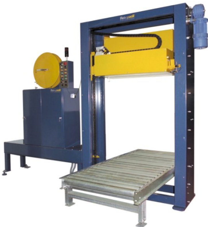
Jednoduchý a přehledný ovládací panel