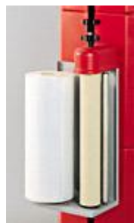
ruční ovládání napnutí folie