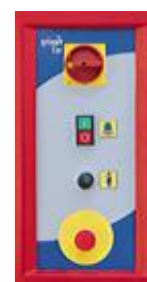
přehledný ovládací panel