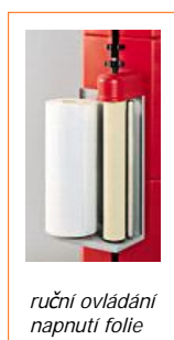
ruční ovládání napnutí fólie