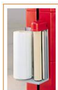
nastavitelné napnutí fólie pomocí elektronické brzdy